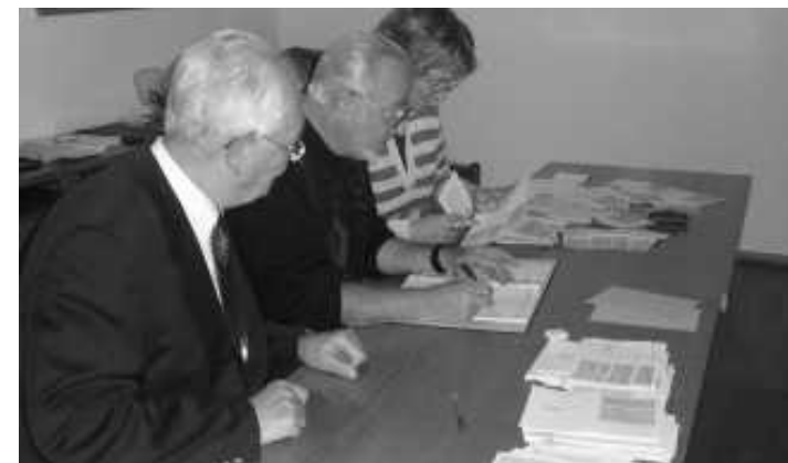
Unser Wahlausschuss beim Stimmen zählen

Und ein drittes: Die Möglichkeit zur Briefwahl brachte nicht das erhoffte Plus bei der Wahlbeteiligung. Schlimmstenfalls hat sie ein weiteres Abrutschen verhindert. Der zusätzliche Aufwand hat sich so vielleicht nicht gelohnt. Das wird noch genauer zu analysieren sein. Um so verwirrender waren die Wahlunterlagen und die Menge des Papiers (unsere fleißigen Helfer verbrachten fast einen ganzen Tag mit dem Zusammenstellen der Wahlumschläge). Wir können zufrieden sein, dass so viele fleißigen Hände und eifrige Wahlhelfer die Wahl erst möglich machten. Ihnen gilt vor allem unser Dank. Schade allerdings, dass die meisten Umschläge im Papierkorb landeten. (af)