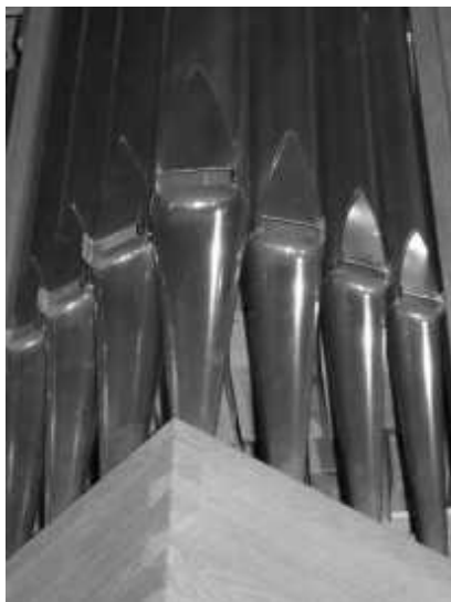
Orgelpfeifen der Mathäuskirche