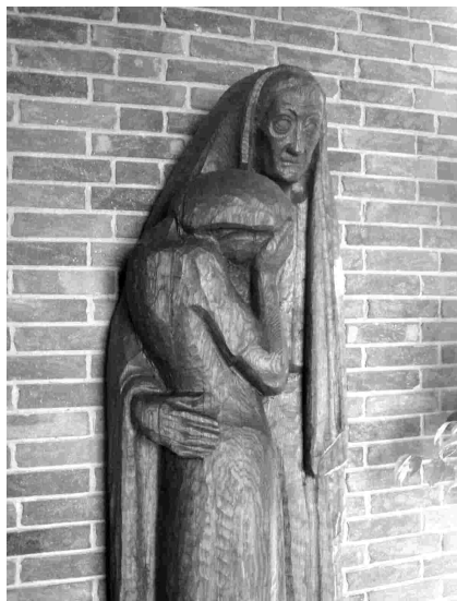
Kriegsende: Eine schwierige Beziehung